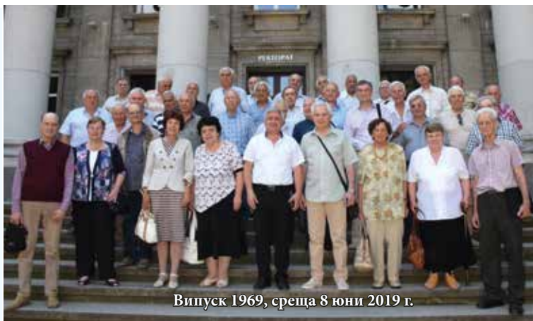
Випуск 1969, среща 8 юни 2019 г.