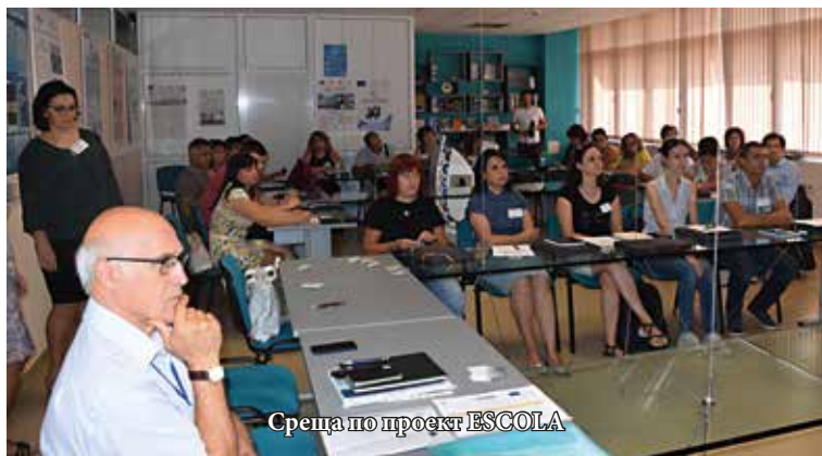
Среща по проект ESCOLA