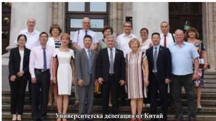
Университетска делегация от Китай

Възможността за съвместно обучение и издаване на двойна диплома по специалност „Електроника“ е естествено последствие от успешната до момента работа по специалност „Компютърно инженерство“, както и по програмата Еразъм+, в която е одобрен обмен на преподаватели и студенти между университетите за втора поредна година.