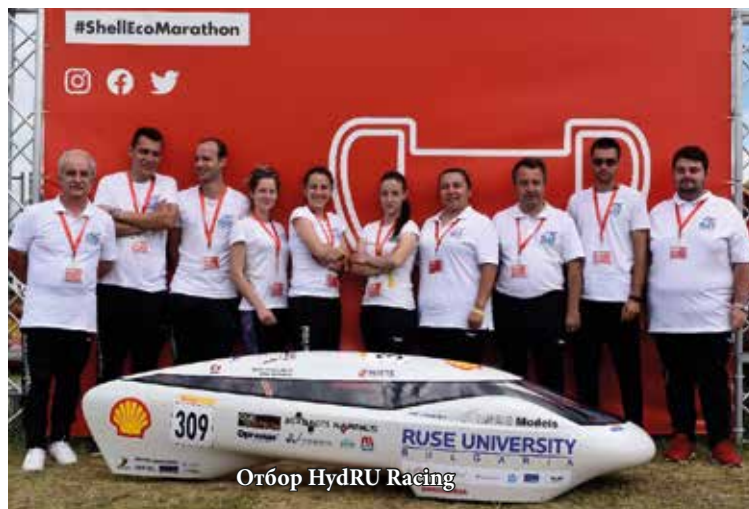
Отбор HydRU Racing

Отборът „Автомобилист“ участва в състезанието за шести пореден път. Екипът се състезава с прототип на електрическа батерия в категорията за екоболиди. Тийм „Автомобилист“ измина 424 km/kWh и се класира на 15-о място от 41 участници в клас прототипи, задвижвани от електрическа батерия. Екипът беше разработил изцяло нов автомобил. Дизайнът на електромобила бе оценен високо от организаторите на състезанието.