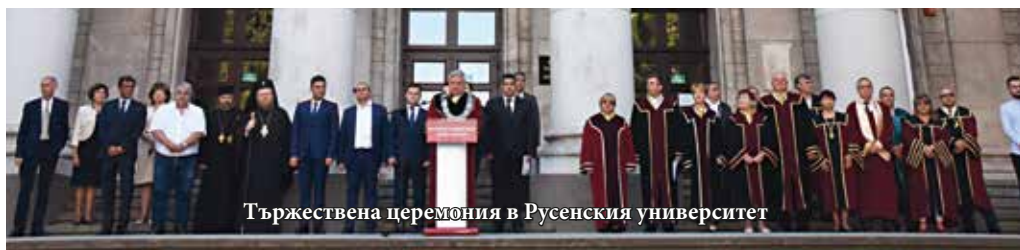
Тържествена церемония в Русенския университет