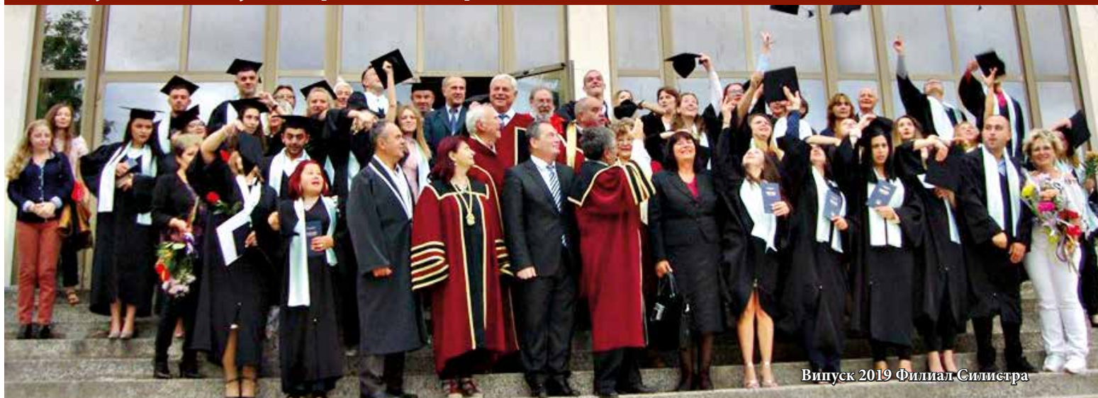
Випуск 2019 Филиал Силистра