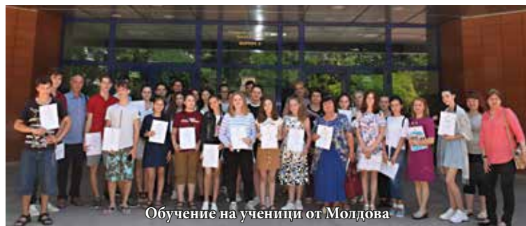
Обучение на ученици от Молдова

Ректорът на университета чл-кор. проф. д-р Христо Белоев изрази надеждата си групата да запази атмосферата на топли и приятелски чувства