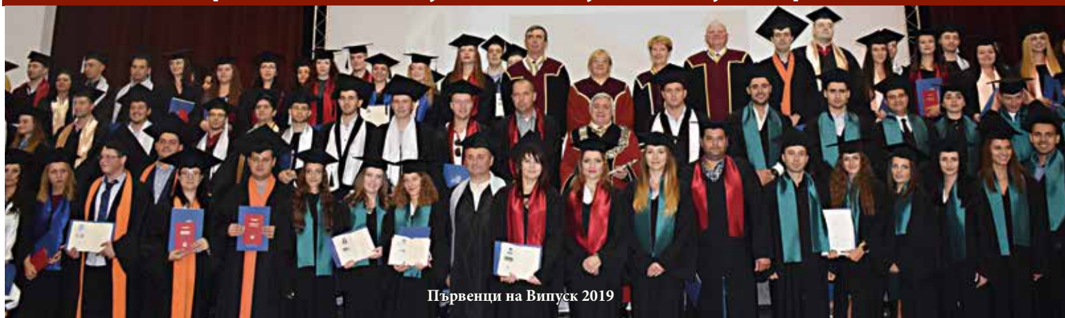
Първенци на Випуск 2019