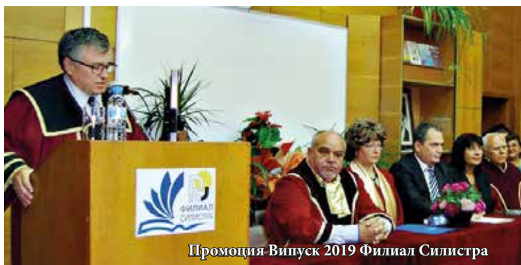
Промоция Випуск 2019 Филиал Силистра

На 19 септември 2019 г. в зала „Проф. Славчо Иванов“ на Филиал Силистра на Русенския университет бе проведено тържество по откриване на новата академична година, заедно с представяне на абсолвентите от випуск 2019 по инженерни и педагогически специалности – редовно и задочно обучение.