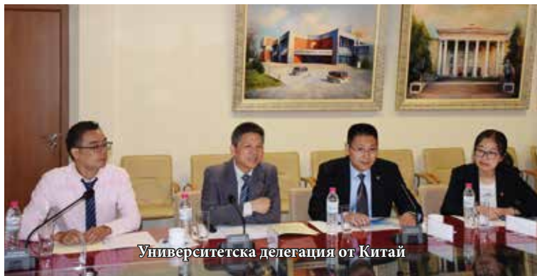
Университетска делегация от Китай

Шанхайският политехнически университет е създаден през 1960 г., обучава студенти в 78 специалности, като основната им част е в областта на инженерството. Висшето училище обучава и в специалностите мениджмънт, икономика, литература, наука и изкуство. В него работят 1100 души, от които