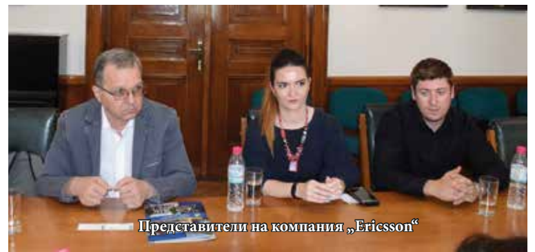
Представители на компанията „Ericsson“