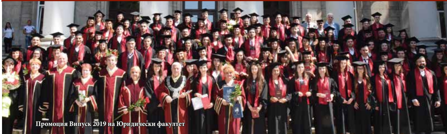
Промоция Випуск 2019 на Юридически факултет

На 14 юни абсолюенти от Випуск 2019 на Юридическия факултет към Русенския университет „Ангел Кънчев“ получиха своите дипломи на тържествена церемония.