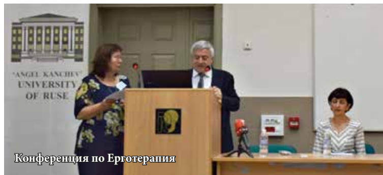
Конференция по Ерготерапия

университет е съорганизатор на първата международна конференция по ерготерапия, проведена в град Бакъу, под мотото „Ерготерапия – настояще и