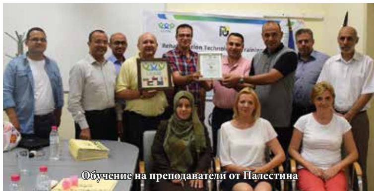
Обучение на преподаватели от Палестина

Група от 10 преподаватели от университети в Палестина – Газа, бе на посещение в Русенския университет, за да премине ускорен курс по Кинезиология.