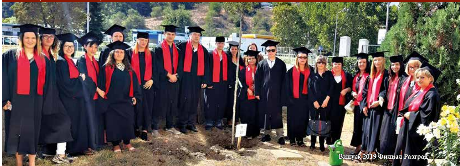
Випуск 2019 Филиал Разград